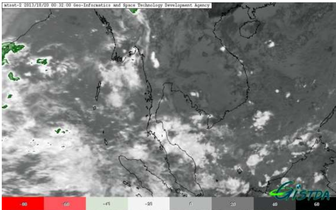
ภาพที่ 1 ข้อมูลจากดาวเทียม MTSAT-2 แสดงสภาพอากาศ ณ วันที่ 20 ตุลาคม เวลา 07.32 น.

กรมอุตุนิยมวิทยา รายงานสภาพอากาศประจำวันที่ 20 ตุลาคม 2556 เมื่อเวลา 06.00 น. บริเวณความ กดอากาศสูงจากประเทศจีนยังคงแผ่ลงมาปกคลุมประเทศไทยตอนบน ทำให้บริเวณภาคตะวันออกเฉียงเหนือ ภาคกลาง และภาคตะวันออกมีฝนลดลง กับมีอากาศเย็นลง และอุณหภูมิจะลดลง 1- 3 องศาเซลเซียส ส่วนลม ตะวันออกเฉียงเหนือพัดปกคลุมอ่าวไทยและภาคใต้ ทำให้บริเวณดังกล่าวยังคงมีฝนหนาแน่น และมีฝนตกหนัก บางแห่ง