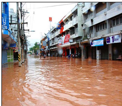
พื้นที่ประสบอุทกภัยบริเวณจังหวัดน่าน

อิทธิพลของพายุลูกนี้ทำให้มีฝนตกหนาแน่นเป็นบริเวณกว้างในภาคเหนือ โดยเฉพาะพื้นที่บริเวณจังหวัดเชียงราย พะเยา น่าน และตากมีรายงานฝนตกหนักถึงหนักมากต่อเนื่องในช่วงวันที่ 25 - 26 มิ.ย. ก่อให้เกิดน้ำท่วมฉับพลัน น้ำป่าไหลหลาก และดินถล่ม สร้างความเสียหายเป็นบริเวณกว้างในพื้นที่ดังกล่าว โดยปริมาณฝนสูงสุดใน 24 ชั่วโมงวัดได้ 335.2 มิลลิเมตรที่อุทยานแห่งชาติดอยภูคา อ.ป่า จ.น่าน เมื่อวันที่ 25 มิ.ย. จากอุทกภัยในครั้งนี้ทำให้มีผู้เสียชีวิต 1 ราย (อ.แม่สอด จ.ตาก) และสูญหาย 1 ราย (อ.เวียงสา จ.น่าน) โดยมีประชาชนได้รับความเดือดร้อน 37,147 ครัวเรือน 118,856 คน พื้นที่เกษตรเสียหายกว่า 53,227 ไร่ (ที่มา : กรมป้องกันและบรรเทาสาธารณภัย ณ วันที่ 29 มิ.ย. 2554)